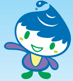
泉区のマスコットキャラクター「いっずん」