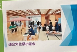
連合文化祭お茶会