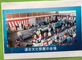
連合文化祭展示会場