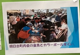
朝日台町内会の金魚とカラーボール等く