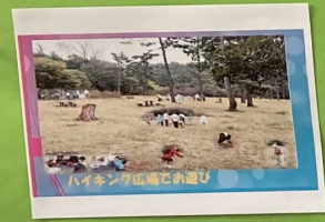
ハイキック広場で遊び