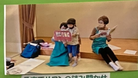
子育てサロンの読み聞かせ