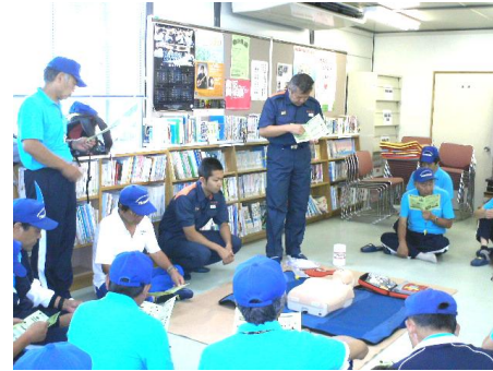
心肺蘇生法 (AED) 研修