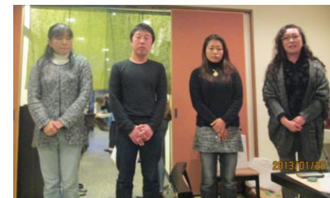
「子ども水泳教室」講師