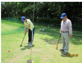
目指せ！パープレイ