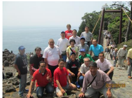
ウォーキング研修（城ヶ崎）