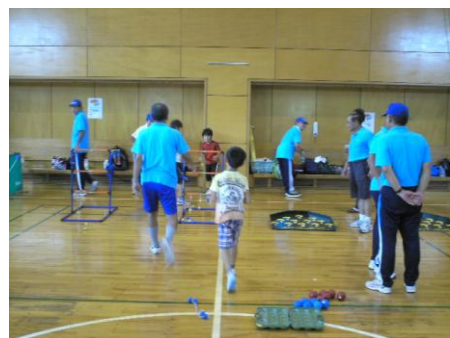
ラダーゲッター、スカットボール