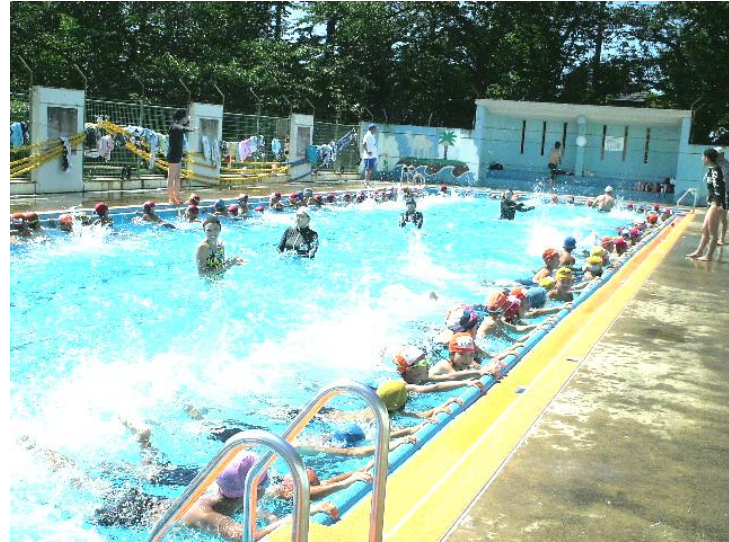
基本はバタ足から