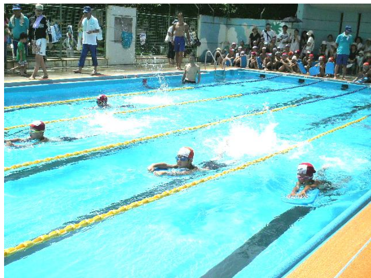
参加者全員でのリレー(最終日)

毎年恒例の「子ども水泳教室」は、子供達に水に触れ合う楽しさを知ってもらい、泳ぎの苦手な子供達は、25mを泳げるようになる事を目的として取り組んでいます。