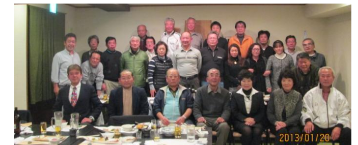
スポーツ推進委員祝賀会・新年会出席者