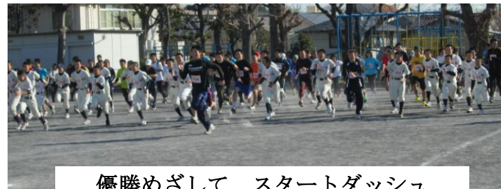
優勝めざして スタートダッシュ