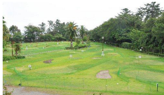
お林展望公園パークゴルフ場

場所：真鶴 「朝日の家 真鶴荘」、お林展望公園 内容：ウォーキング、パークゴルフ