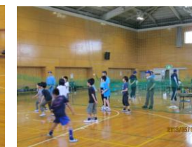
ドッチボール・卓球