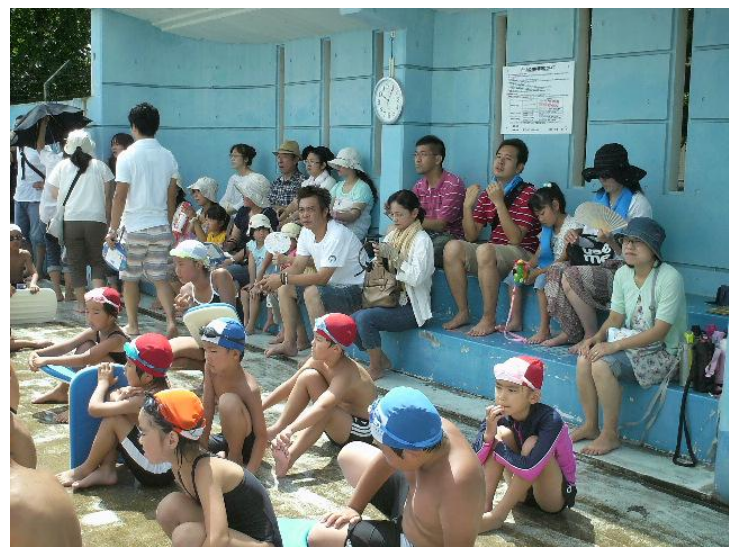
多くの応援を受け頑張れる記録会(最終日)