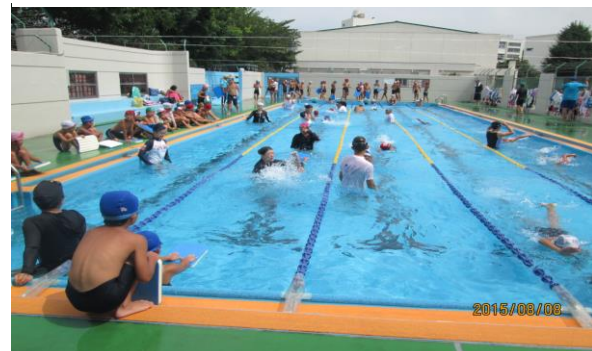
8月5日～8日 クラス分け講習