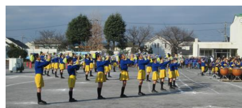
今年も盛り上げてくれました。