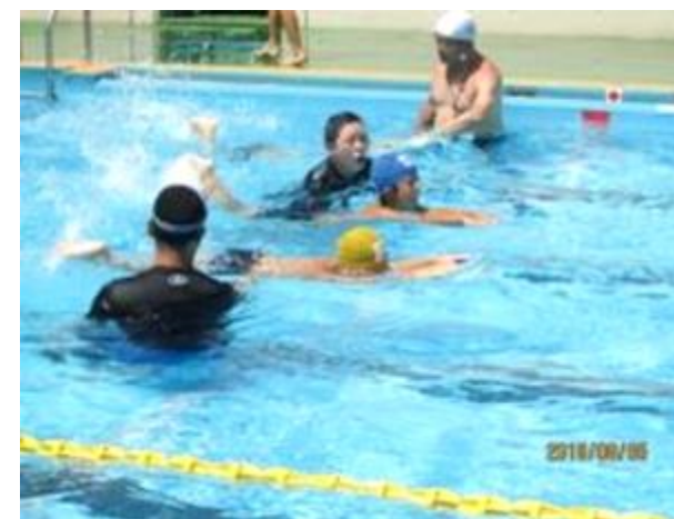
8月3日～6日 クラス分け講習