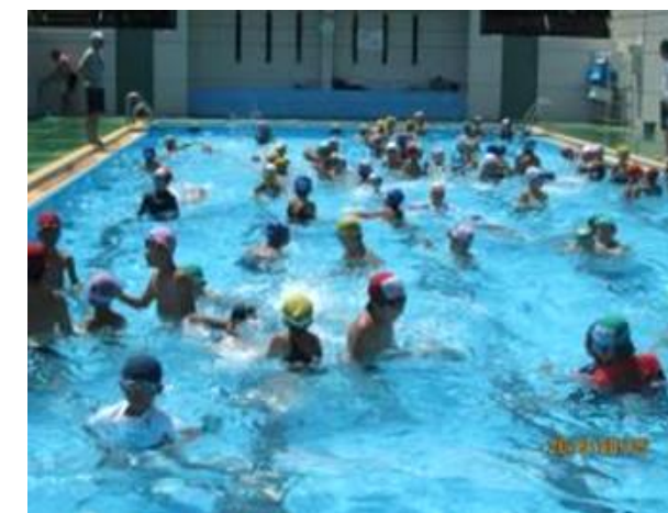
8月3日～6日 講習後の自由時間