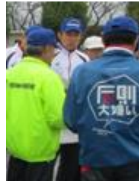
連合ベタンク大会にて打合せ中

この一年、スポーツ推進委員として、自分なりにがんばってきました。地域の皆さんへのスポーツ推進に、微力ながらも貢献できたと思います。残り一年、少しでもスポーツの楽しさを伝えられればと思います。