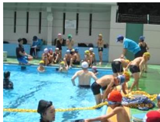
8月3日～6日 クラス分け講習