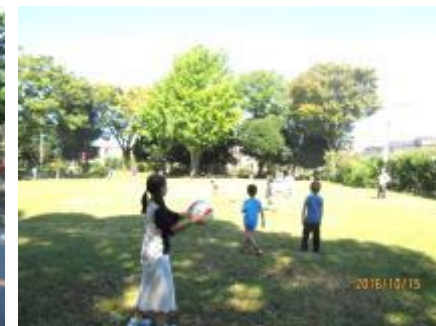
ドッチボール風景