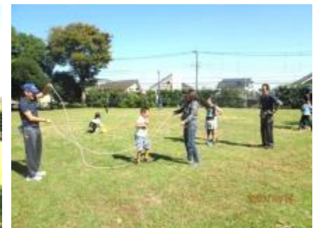
ダブルタッチ風景