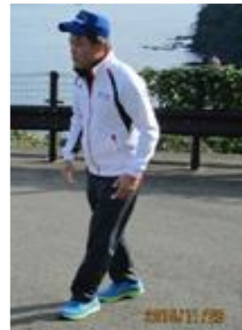
一泊研修にてのストレッチ講義中