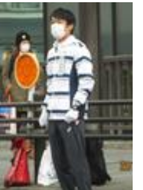
2016 横浜マラソン大会にて警備中

私自身は、仕事の関係上行事に参加できないことが多かったのですが、2年目となる今年度は1年目の経験を生かして、もう少し積極的に活動できるよう頑張りたいと思います。今後とも、ご指導のほどよろしくお願いいたします。