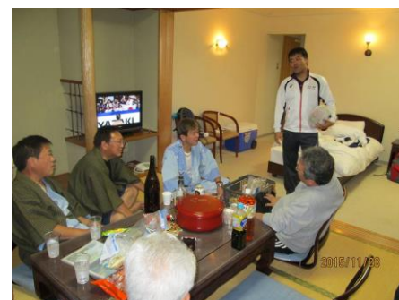
ラグビー講座(興味津々です)