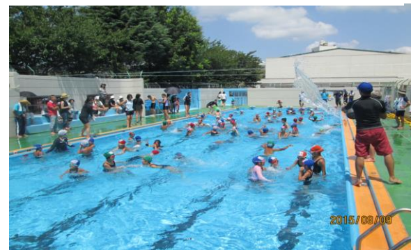
8月5日～8日 講習後の自由時間