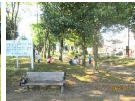
ドングリ拾い風景