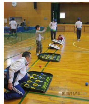
スカット・輪投げ