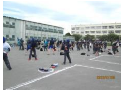
研修前の準備体操