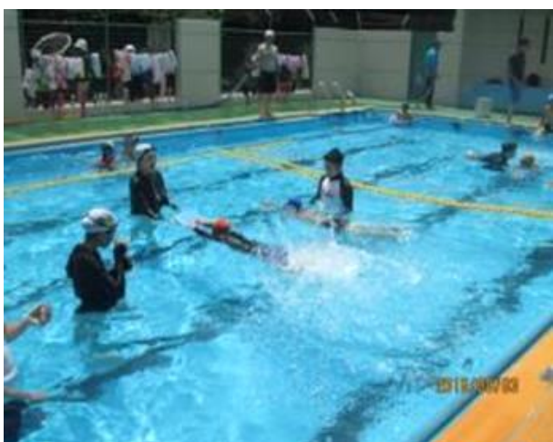
8月3日～6日 クラス分け講習