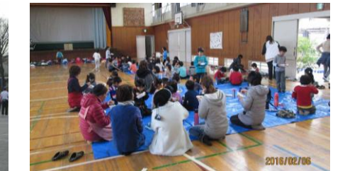
熱戦が繰り広げられました