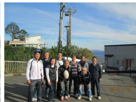
スポーツ推進委員