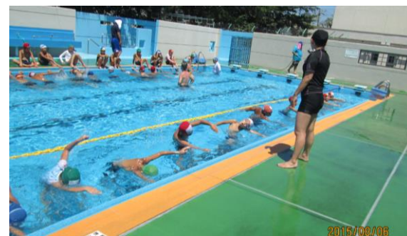
8月5日～8日 クラス分け講習