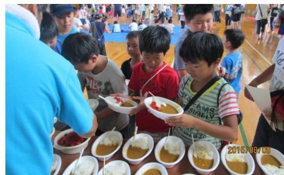
8月9日 閉講式後のカレー食事会