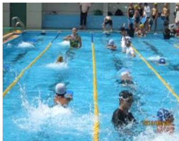
8月3日～6日 クラス分け講習