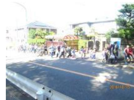
白百合公園へ向かう