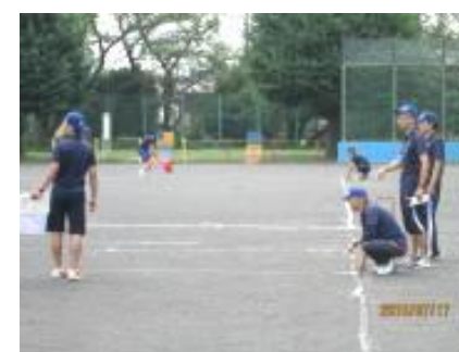
試合前のコート作り

暑い夏のイベント、町内会対抗の小学生ドッチボール大会が、今年も中田小学校で盛大に執り行われました。スポーツ推進委員は、体育部とともに、コートづくり、審判の主審・副審を務めました。高学年と低学年に分かれ、試合が始まると、こどもたちの目の色が変わります。真剣な眼差しでボールを投げ、受け、ときにはボールをかわしました。そんなこどもたちの熱い姿を見て、周りの保護者たちも、より一層応援に熱が入っていました。勝ったチームも負けたチームも、うまくいったチームもそうでないチームも、いろいろあったと思いますが、みんなで協力して正々堂々戦ったこどもたちはどのチームも立派でした。最後になりましたが、開催にあたり、ご協力いただいた皆様に深く感謝します。ありがとうございました。 (伊藤ドッチボール大会担当：ひがしが丘)