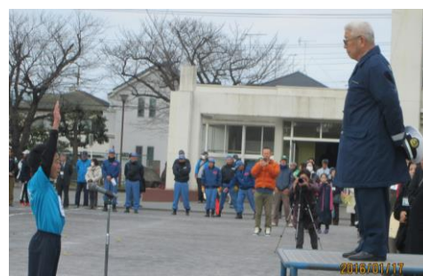
堂々とした選手宣誓