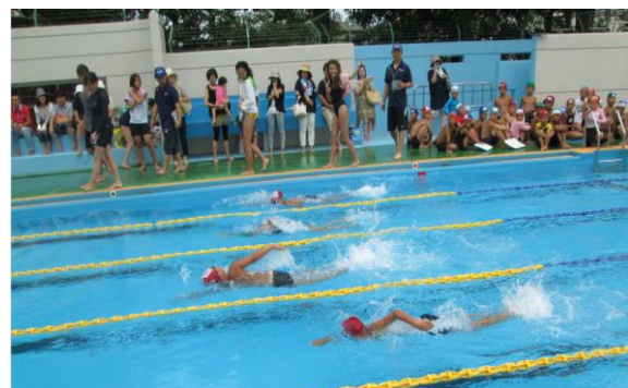
8月9日 記録会/受講者リレー