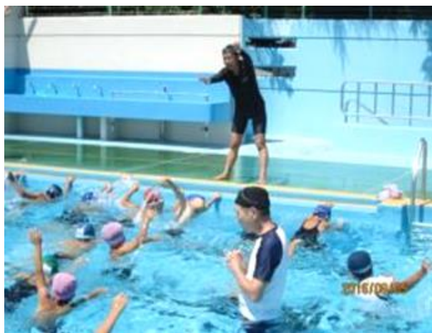
8月3日～6日 クラス分け講習