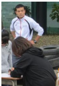
ふれあい Doingにて幅跳び担当中

一年を振り返ると、仕事でイベントにほとんど出席出来ませんでしたが、嫌な顔せず、イベント出席時、温かく迎えてくれる先輩方に感謝しております。