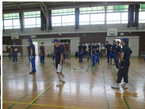
ファミリーバドミントン