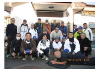
富士見丘自治会館