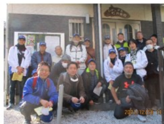
ひがしが丘町内会館