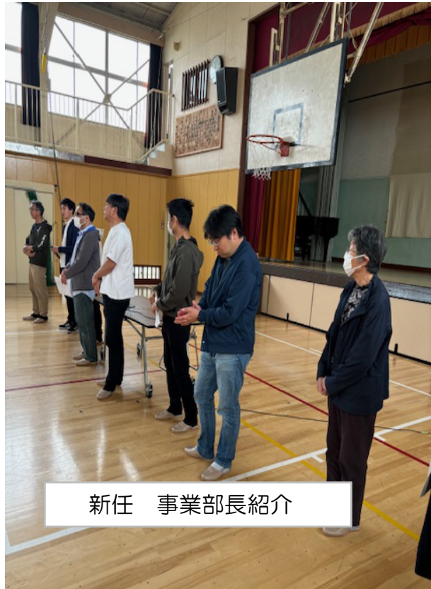
新任 事業部長紹介