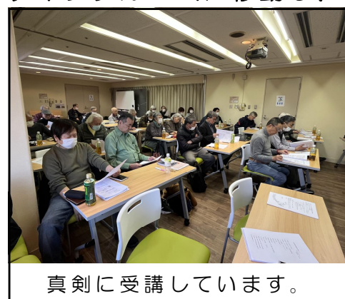
真剣に受講しています。

ひとり一人の近況が話されるなど和気藹々とした雰囲気です。懇親を深めることができました。