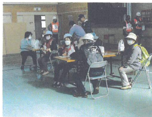
中田中学校での写真