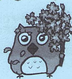
イメージキャラクター しもずく

地域ケアプラザは、介護や生活の困りごとの総合相談窓口です。 ご相談の際は、事前にご連絡いただくと助かります。 窓口でのご相談は、9時～18時の間で対応します。(日・祝は17時まで) 第4月曜日は、休館日です。