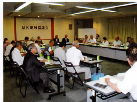
地域協議会の様子

地域の課題について、解決のための事例研究をしたり、情報交換を行ったりすることで、区内12地区の地区経営委員会などの活動に反映させ、より良い地域づくりを目指します。