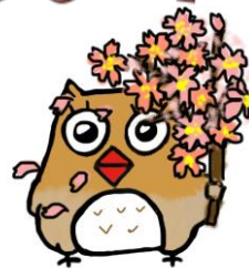
イメージキャラクター しもずく

地域ケアプラザは、介護や生活の困りごとの総合相談窓口です。 ご相談の際は、事前にご連絡いただくと助かります。 窓口でのご相談は、9時～18時の間に対応します。(日・祝は17時まで) 第4月曜日は、休館日です。