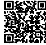
②ボランティア応募