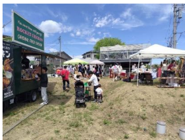
空き地を利用して売店設置

5/9、新橋下自治会の一角(まほろば出会いの広場付近)でご近所の有志から始まったご近所フェスが開催されました。今年で3回目だそうです。公園もない住宅地で好条件とは言えないけれど、空き地や個人宅の庭先を活用した文字通り手作りのお祭りです。空き地にお店を開き身の回りのものを