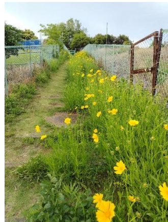
オオキンケイギクの群落

しかし、外観はとてもかわいい黄色の花で、目を楽しませてくれます。これが栽培禁止とは思ってもよかったです。