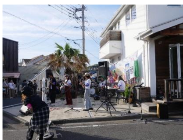
ご近所の一角で演奏風景

物々交換したり、移動販売のお店もありました。ゲームコーナーでは子ども達が歓声をあげていました。また演奏などもあり、皆さん思い思いに楽しんでいる様子です。お祭りはもともと人々が集まって身の丈で楽しむところから始まったので