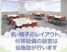
机・椅子のレイアウト、付帯設備の設置は当施設が行います

福祉保健研修交流センター ウィリング横浜 上大岡駅 徒歩3分 多様な貸会議室をご用意しています 4～240名まで収容可能な研修室、実習室、和室など30室を備えています。打ち合わせ、研修、会議と幅広い用途でご利用いただけます。ぜひご利用ください。 ※有料・要事前予約