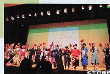
当日は300名近い来場者で大賑わい