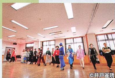
本番まで5回、衣装合わせやモデルウォーキングの練習をしました

ステージに立ったのは、65歳以上の女性モデル18人。プロの指導のもと、モデルウォーキングや振付を練習しました。本番に向けて練習を重ねるごとに、仲間同士で声をかけあいながら、より素敵なステージを目指していききと取り組む姿が見られました。メイクは「介護×美容」のプロスクールである介護美容研究所の協力もいただき、また音響や照明、イラスト等は地域の方や障害のある若者も参加し、さまざまな方が関わる温かなイベントとなりました。