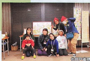
多様な人たちが運営の手伝いをしてくれました