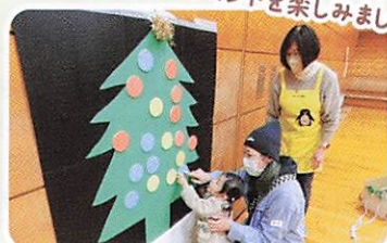
この日はクリスマスのイベントを楽しみました