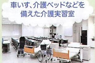
車いす、介護ベッドなどを備えた介護実習室