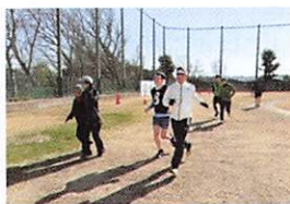
▲伴走ボランティアさんと共に 頑張る練習