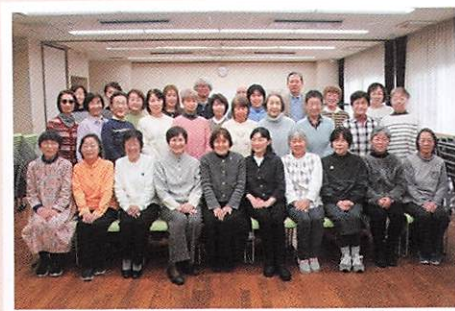
釜利谷地区民児協の皆さん