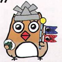
イメージキャラクター しもずく

地域ケアプラザは、介護や生活の困りごとの総合相談窓口です。 ご相談の際は、事前にご連絡いただくと助かります。 窓口での相談は、9時～18時の間に対応します。(日・祝は17時まで) 第4月曜日は、休館日です。(祝日の場合は翌日の火曜日) 5月は5月25日(月)が休館となります。