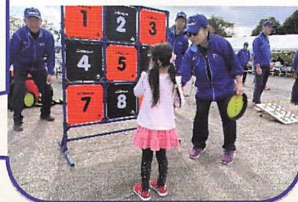
子どもたちとのふれあいも楽しい時間です