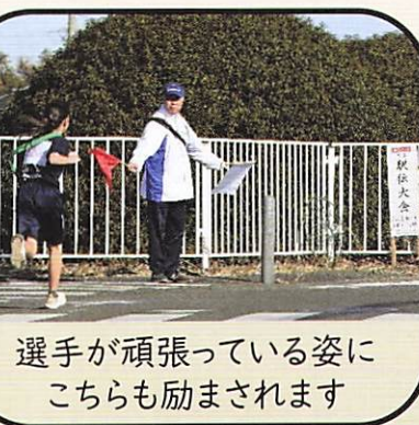
選手が頑張っている姿にこちらも励まされます