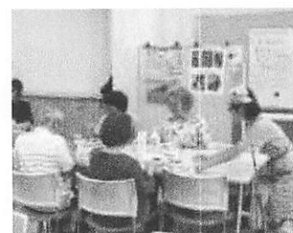
配膳等を手伝う様子