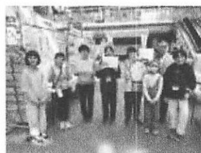
泉わくわくプラン推進イベント