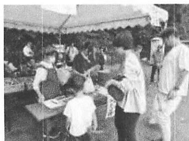
お祭りのブースを手伝う様子