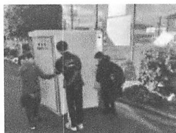
災害用トイレの設置訓練等を手伝う様子